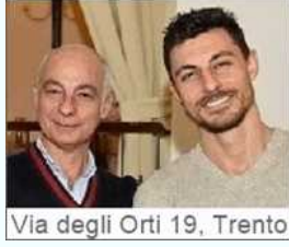
Via degli Orti 19, Trento