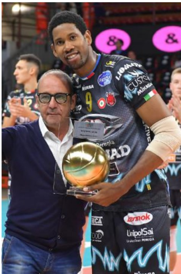
Wilfredo Leon premiato prima del match con Calzedonia

SPECIALE #VERONAMILANO. Sottoscrivendo l'abbonamento per il girone di ritorno entro venerdì 20 dicembre, uno sconto speciale del 50% sul prezzo del biglietto per Calzedonia Verona - Allianz Milano, valido per lo stesso settore dell'abbonamento.