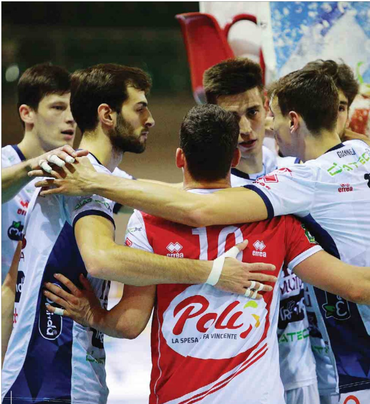
L'abbraccio dell'Itas Trentino: a Sora la squadra gialloblù è tornata al successo in Superlega