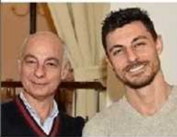
Via degli Orti 19, Trento