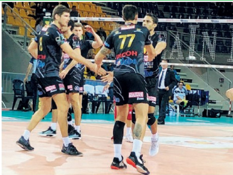
In maglia scura gli atleti della GloboBPF durante la gara con Trento