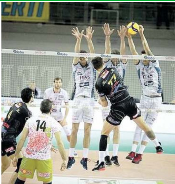
Un momento della sfida giocata a Veroli tra Sora e Trento, vinta dagli ospiti che hanno accelerato per chiudere i set